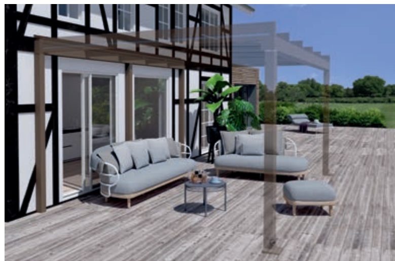
Exemple de façade à colombage, Raccord Mural Porteur et Terrazza Pure