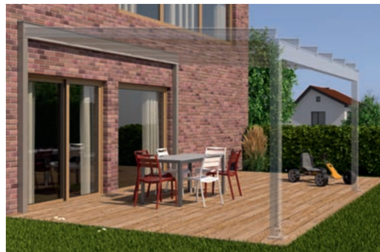
Exemple de façade en briques recuites, Raccord Mural Porteur et Terrazza Semptra