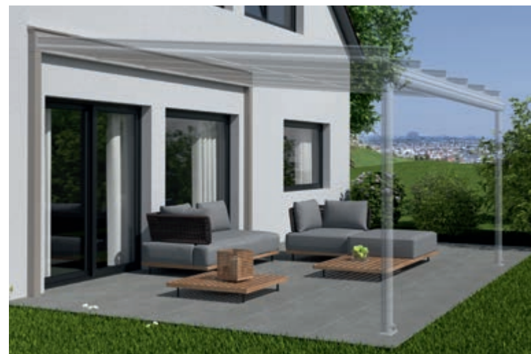
Exemple de façade de maison très bien isolée: Raccord Mural Porteur et Terrazza Originale