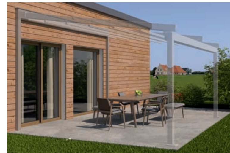
Exemple de maison préfabriquée avec ossature en bois: Raccord Mural Porteur et weinor PergoTex II